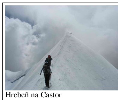
Hrebeň na Castor

okolo druhej poobede. Záverečný hrebeň je pekne ostrý a cestou naň treba prekonať trhlinu, čo je pri zostupe ešte náročnejšie. Nádherné pohľady sú odmenou a s dobrým pocitom, pre niektorých z nás prvej dosiahnutej štvortisícovky, schádzame pomaly dolu. Večer trávime plánovaním, dopĺňaním tekutín z rôznych zdrojov a užívaním si pohľadov z verandy bivaku.